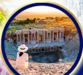
นครเฮียราโพลิส