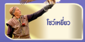
โชว์เหยี่ยว