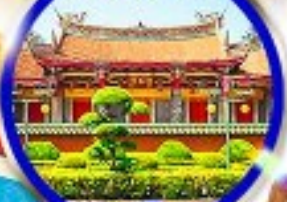
วัดชิงเทียนกง