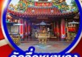
วัดจื่อหนานกง