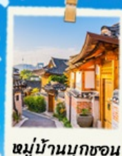
หมู่บ้านนุกซอน