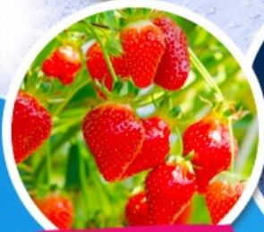
ไร้สตรอว์เบอร์รี่