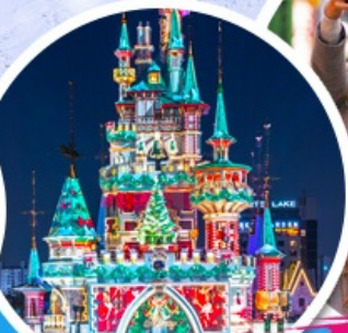
สวนสนุกค็อดเต้