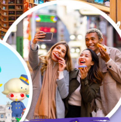
ตลาดเมียงดง