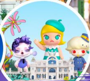
ซื้อบิง POP MART