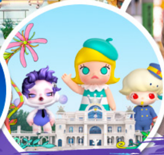
ช้อปบิง POP MART