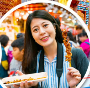
ตลาดควางจ้ง