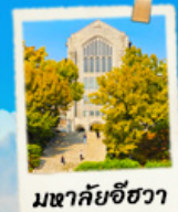
มหาชัยชีวา