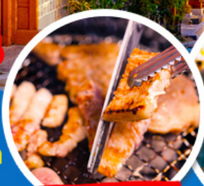
หมู่บ้านเกาหลี