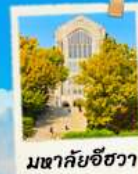
มหาชัยชีวา