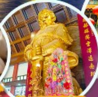
วัดเขากงเมี้ยว