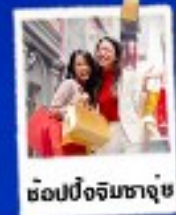
ช้อปปิ้งจิมซาจूस