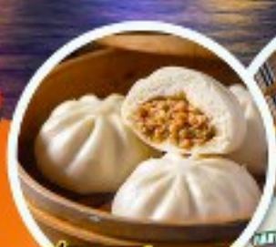
ติ่มซำฮ่องกง