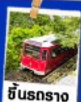
ซินรถราง