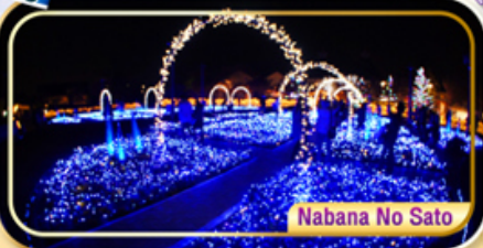
Nabana No Sato