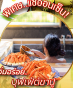
อิมมอร์รี่... บุฟเฟ่ต์ขาปู