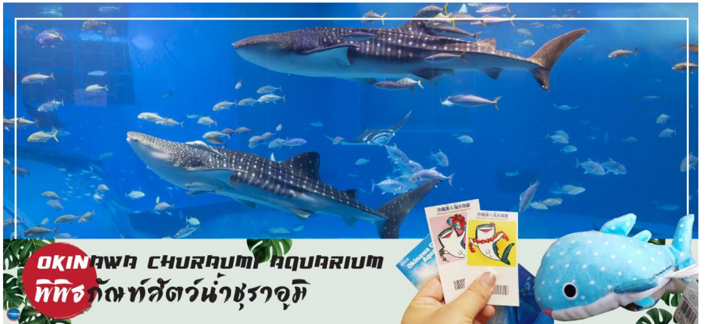
OKINAWA CHURAU MI AQUARIUM พิพิธภัณฑ์สัตว์น้ำชुरาอุมิ

เช้า รับประทานอาหารเช้า ณ ห้องอาหารของโรงแรม (1) นำท่านชม พิพิธภัณฑ์สัตว์น้ำชुरาอุมิ (OKINAWA CHURAU MI AQUARIUM) (ใช้เวลาเดินทางประมาณ 1.40 ชั่วโมง) เป็นพิพิธภัณฑ์สัตว์น้ำที่ดีที่สุดในประเทศญี่ปุ่น ไฮไลท์!!! ของการเยี่ยมชมพิพิธภัณฑ์สัตว์น้ำแห่งนี้คือแทงก์น้ำโครซิโอะ ซึ่งเป็นหนึ่งใน แทงก์น้ำที่ใหญ่ที่สุดของโลก ซึ่งภายในนั้นเต็มไปด้วยสิ่งมีชีวิตในทะเลแถบโอกินาวาที่หลากหลาย สัตว์น้ำที่โดดเด่นที่สุดคือฉลามวาฬยักษ์ และกระเบนราหู อีสระให้ท่านได้เพลิดเพลินกับสัตว์น้ำหลากหลายชนิด ทั้ง ปลาตาว ฉลาม ฉลามเสือ และฉลามวัว ปลาเรืองแสง ตลอดจนหอยต่างๆ นอกจากนี้ยังมีสระน้ำกลางแจ้งที่ตั้งอยู่ใกล้ริมน้ำซึ่งเป็นที่จัดการแสดงของโลมาแสนรู้ เต่าทะเล และพะยูน ที่จัดขึ้นเพียงไม่กี่ครั้งต่อวัน (ไม่มีค่าใช้จ่ายเพิ่มเติม แต่ต้องตรวจสอบเวลาการแสดงก่อนชมนะคะ)