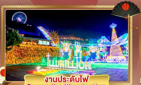
งานประดับไฟ Sagamiko Illumination

ชมความสวยงามแห่งเมือง อิบารากิ เที่ยวครบทุกวัน ฟังเสียงคลื่นซัด ณ เสาโทริอิกลางโหนดหิน