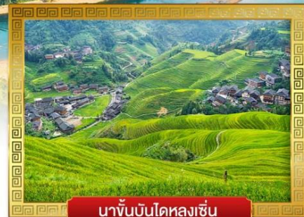
นาขั้นบันไดหลงเซ็น