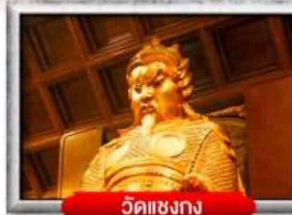
วัดแชงกง