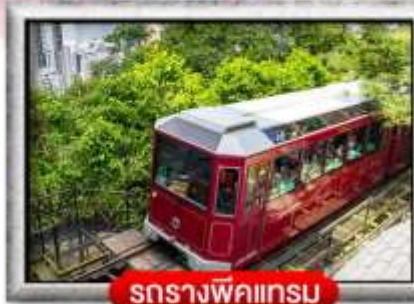
รถรางพิกแนม