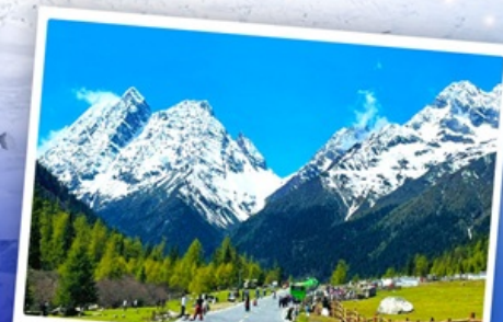
กุเวาสีดรุณี