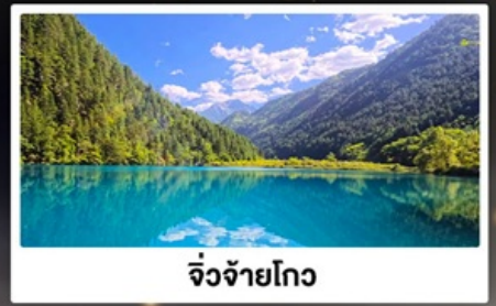
จิ้งจ้ายโกว