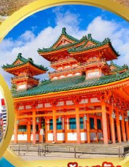
ศาลเจ้าฮอวัน

ชมความงามธรรมชาติ ณ อุทยานคามิโคจิ ชมปราสาทฮิกาตsuma ณ ปราสาทมิตสึโมโตะ ใช้รถทุกวัน ไม่มีวันอิสระ