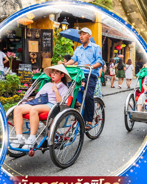
นั่งรถสามล้อซีโคล่