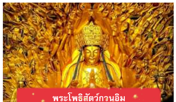
พระโพธิสัตว์กวนอิม

นำท่านเดินทางสู่ มรดกโลกอุทยานผาหินแกะสลักต้าจู๋ ศิลปะหินแกะสลักอันล้ำค่าแห่งเมืองฉงชิ่งมรดกโลกที่องค์การยูเนสโกขึ้นทะเบียนเมื่อปี ค.ศ. 1999 ตั้งอยู่ทางตะวันตกของนครฉงชิ่ง ประเทศจีน ศิลปะหินแกะสลักเหล่านี้สร้างขึ้นตั้งแต่ราชวงศ์ถังจนถึงราชวงศ์ซ่ง มีอายุมากกว่า 1,000 ปีโดดเด่นด้วยงานแกะสลักทางพุทธศาสนาที่งดงามและยังคงสภาพสมบูรณ์ (ใช้เวลาเดินทางประมาณ 1-2 ชั่วโมง)