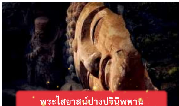
พระไสยาสน์ปางปรินิพพาน