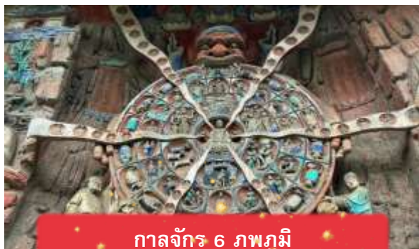
กาลจักร 6 ภพภูมิ