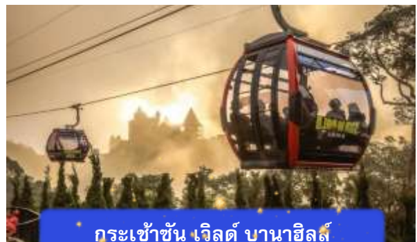
กระเช้าขึ้น เวิลด์ บานาฮิลล์