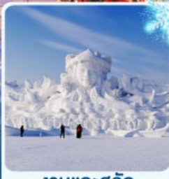
งานแกะสลัก เกาะพระอาทิตย์