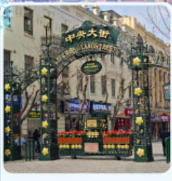
ถนนจงยาง