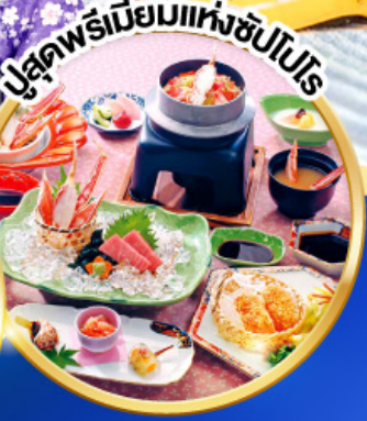
บุฟเฟ่ต์พรีเมียมแห่งซัปโปโร

ขึ้นกระเช้า UNKAI GONDOLA ชมวิว UNKAI TERRACE