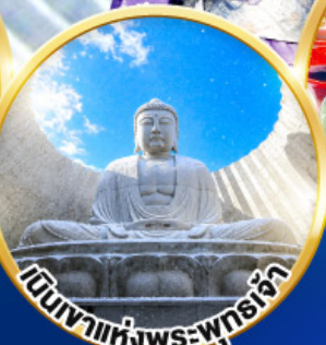
เดินทางแห่งพระพุทธรูป