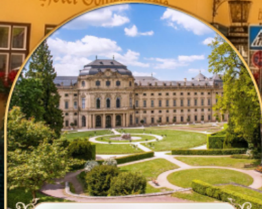
พระราชวังแวร์ซายส์ นคร ปารีส ฝรั่งเศส