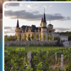
ไร่ไวน์ จุนยี่ เยียนโก