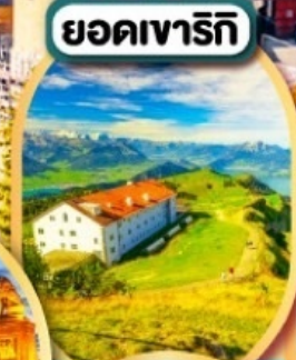
ยอดเขารีกี