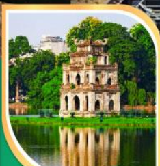
ทะเลสาบคินคอบ