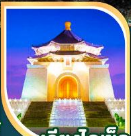
เจียงโกเชิก