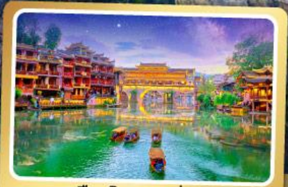
เมืองโบราณฟังหวง