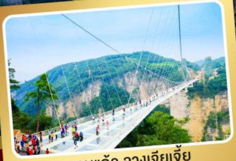
สะพานแกว่ จางเจียเจีย