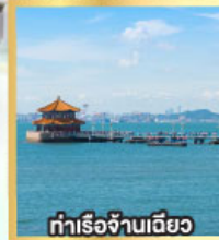
ท่าเรือจ้างเดี่ยว