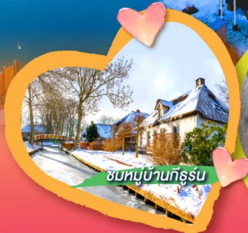
ชมหมู่บ้านกิธูร์น