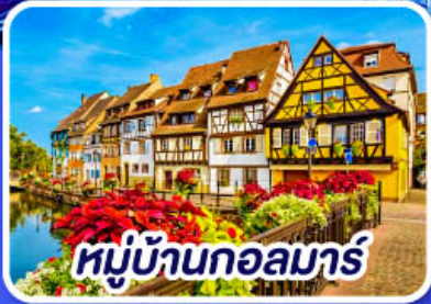
หมู่บ้านกอลมาร์