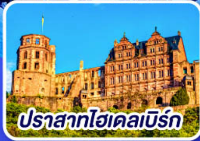
ปราสาทโฮเดลเบิร์ก