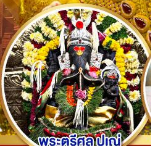
พระศรีศิว ปูणे (Trishul Pune)