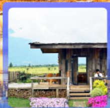
ร้านกาแฟหุบเขาคี๊อัน