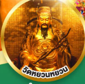
วัดหยวนทวยวน

ขอพรเรื่องสุขภาพ, โชคลาภ ความเจริญก้าวหน้า