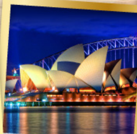
ซิดนีย์โอเปร่า