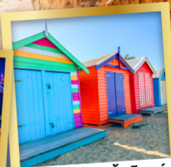
ไบรด์ตัน บาร์ตัง บ็อกซ์

03-10, 12-19 เม.ย.68 24 เม.ย.-01 พ.ค.68 08-15, 22-29 พ.ค.68 29 พ.ค.-05 มิ.ย.68