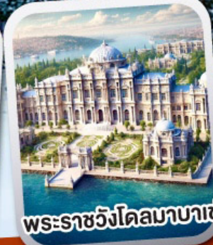
พระราชวังโดลมาบาเซ่