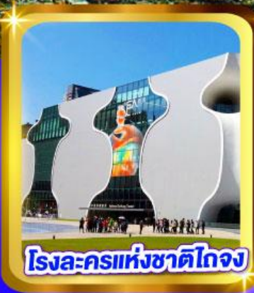
โรงละครแห่งชาติไทจง