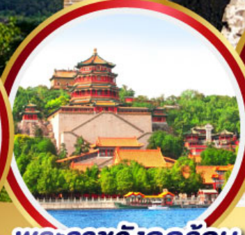
พระราชวังฤดูร้อน อิ๋นโฮ่หยวน