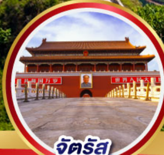
จัตุรัส เทียนอันเหมิน