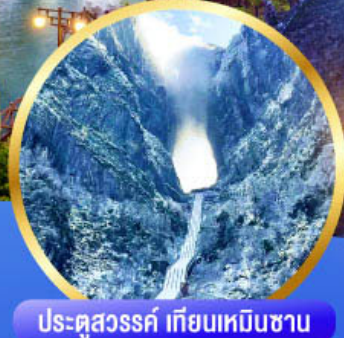
ประตูสวรรค์ เทียนเหมินซาน