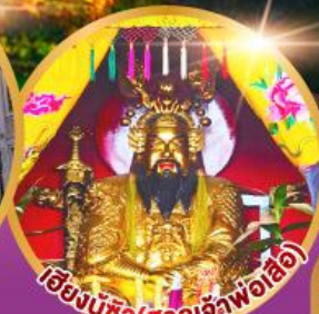
เอ็งบูซิว (ศาลเจ้าพ่อเสือ)

เมนูพิเศษ!! อาหารแต่จิว 18 อย่าง ผ่านพะไลต้นตำรับชัวเถา สุกี้ซิว