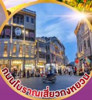
ถนนโบราณเสี่ยวกงหยวน