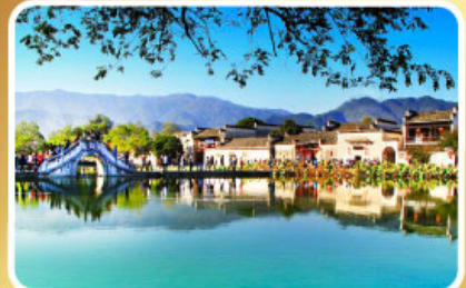
หมู่บ้านผดงโลก หงชุน