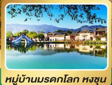
หมู่บ้านมรดกโลก หงชุน