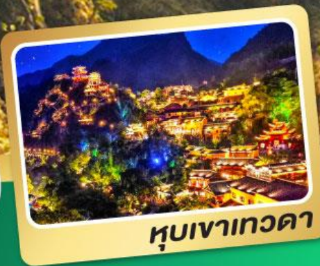
หุบเขาเทวดา