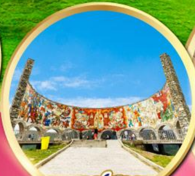
อนุสรณ์สถาน รัสเซีย-จอร์เจีย