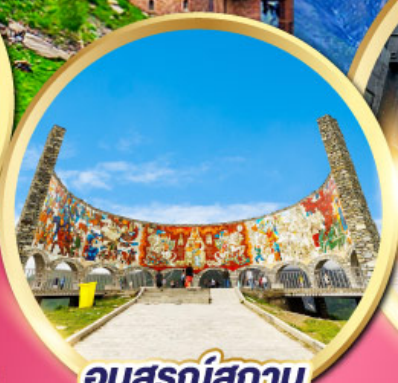
อนุสรณ์สถาน รัสเซีย-จอร์เจีย