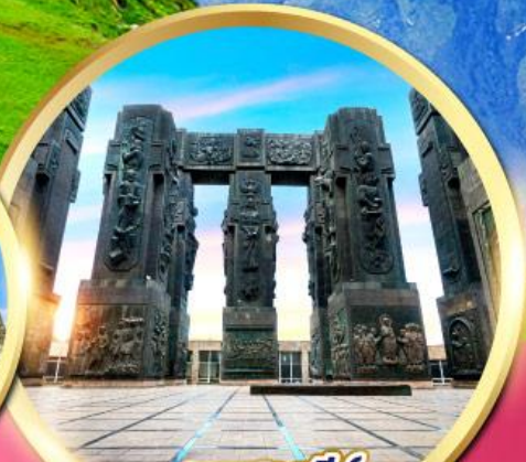
อนุสาวรีย์ ประวัติศาสตร์จอร์เจีย