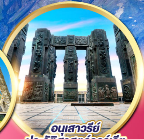
อนุสาวรีย์ ประวัติศาสตร์จอร์เจีย