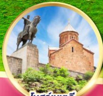
โบสถ์เมเตคิ