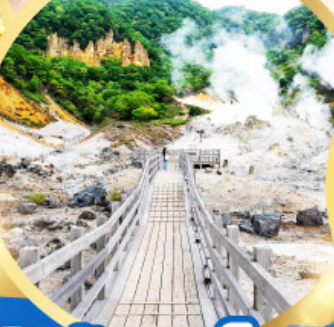
หุบเขารกจิโกกุดาบิ