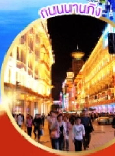
ถนนนานกิง