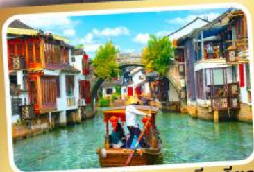
ล่องเรือเมืองโบราณซูเจียเจียว