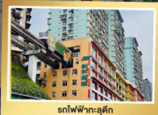
รถไฟฟ้า-ลูตึก