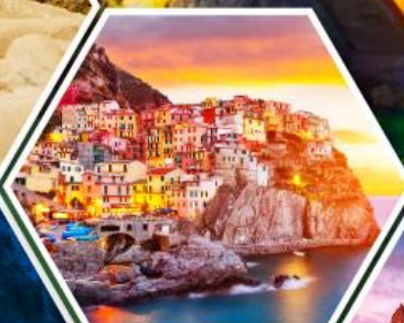
หมู่บ้านมาราโรลา