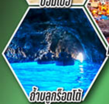
ถ้ำบลูโรตโต