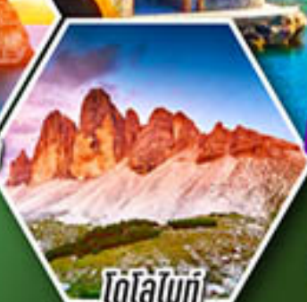
โดโลไมท์

โปรแกรมเดียว เก็บครบจบ อิตาลี ตั้งแต่เหนือถึงใต้