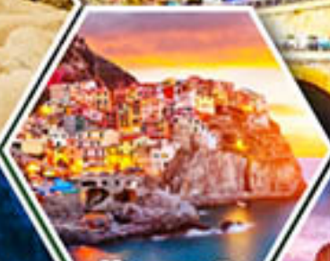
หมู่บ้านมาราโรลา