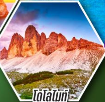
โตโลไมท์