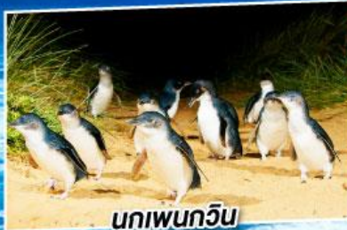
นกเพนกวิน