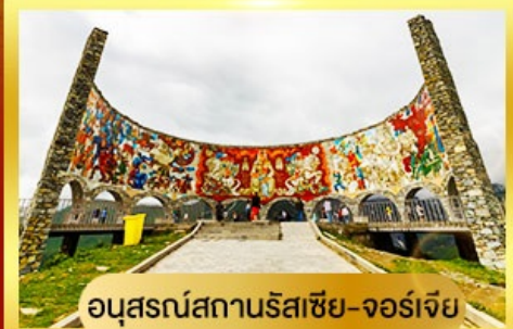
อนุสรณ์สถานรัสเซีย-จอร์เจีย

นั่งรถ 4WD ตะลุยสู่ใจกลางเทือกเขาคอเคซัส | เข้าชมวิหารศักดิ์สิทธิ์ ซามิบา เที่ยวเมืองท่าอันเก่าแก่ อพลิสต์ซิคห์ | พิเศษ มื้ออาหารไทย ณ กรุงทบิลีซี