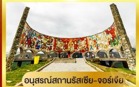
อนุสรณ์สถานรัสเซีย-จอร์เจีย

นั่งรถ 4WD ตะลุยสู่ใจกลางเทือกเขาคอเคซัส | เข้าชมวิหารศักดิ์สิทธิ์ ซามบา เที่ยวเมืองถ้ำอันเก่าแก่ อพอลิสต์ซิคห์ | พิเศษ มีอาหารไทย ณ กรุงทบิลีซี