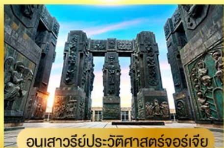
อนุสาวรีย์ประวัติศาสตร์จอร์เจีย

27 ก.ย.-04 ต.ค. / 11-18, 18-25 ต.ค. 67 25 ต.ค.-01 พ.ย. / 08-15 พ.ย. 67