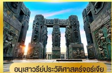
อนุสาวรีย์ประวัติศาสตร์จอร์เจีย

พิเศษ!! พัก ROOMS HOTEL ชมวิวสุดอลังการของเทือกเขาคอเคซัส