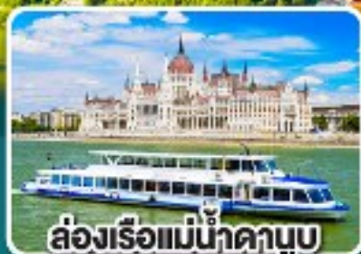
ล่องเรือแม่น้ำดานูบ