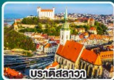
บราติสลาวา