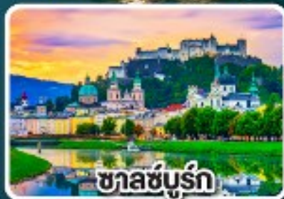
ซาลซ์บูร์ก

มือพิเศษแสนอร่อย เปิดปากถึง , เปิดโบฮีเมีย และหมุกอดเวียนนา