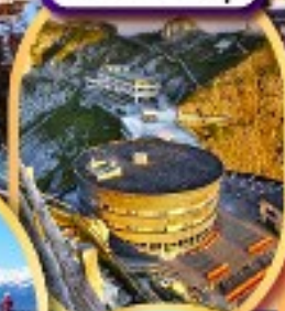
ยอดเขาฟีลาตุส